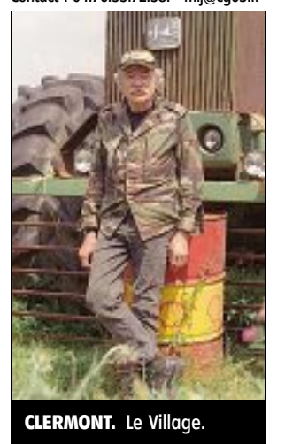
CLERMONT. Le Village.

MOULINS (ALLIER). Benjamin Rabier. Jusqu'au 28 janvier, le MII présente une exposition en hommage à Benjamin Rabier, créateur de la Vache qui rit , Gédéon le canard ... Contact : 04.70.35.72.58. - mij@cg03.fr